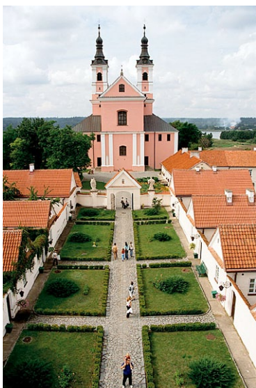
Kamaldulenserkloster Wigry