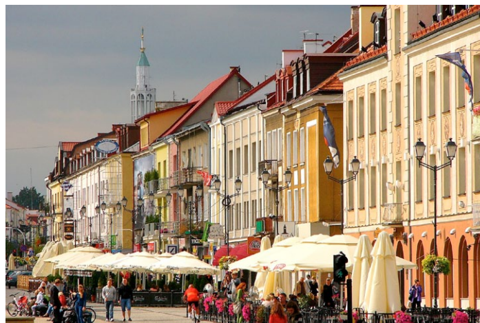
Białystok: Im Sonnenlicht glänzen die Fassaden der Altstadt. Im Hintergrund der Turm der Rochuskirche.