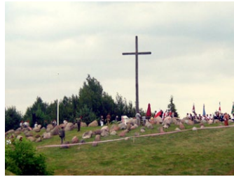
Kreuz in Giby