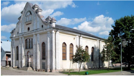
Weißer Synagoge in Sejny